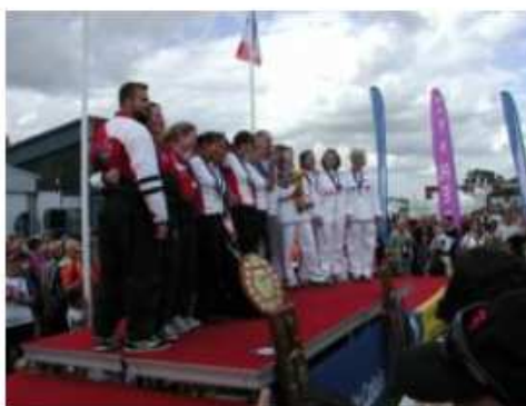
Předávání cen – Maubeuge 2009

V průběhu podniku se uskuteční dva oficiální ceremoniály; zahajovací a závěrečný ceremoniál. Oba oficiální ceremoniály musí proběhnout za účasti sportovců a musí být atraktivní pro veřejnost. Příručka o protokolu je i dispozici u FAI.