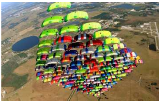
Světový rekord CF - 2008