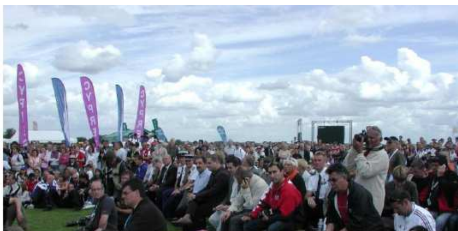
Davy na Mistrovství světa – Maubeuge 2009