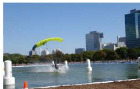
Mistrovství světa v Pilotování padáku – Vídeň 2007

V každém dějišti je požadována zaručená minimální infrastruktura: